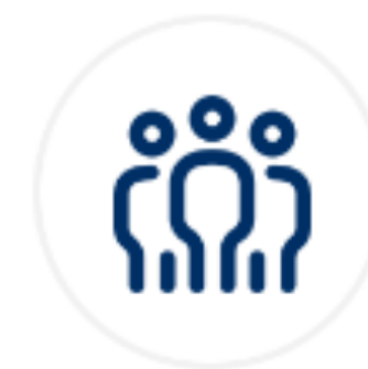
Cohesión social y territorial