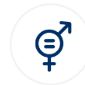
Igualdad de género