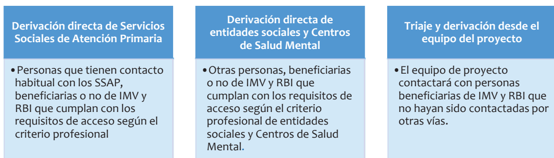
Ilustración 2. Vías de entrada

En su desarrollo se parte de la identificación de todas las potenciales personas beneficiarias de IMV y RBI en los municipios de intervención a través de las bases de datos de beneficiarios de IMV proporcionadas por el Ministerio de Inclusión, Seguridad Social y Migraciones y las de beneficiarios del RBI proporcionadas por el IMAS y tras eliminar duplicidades y personas que no cumplen requisitos, se crea un listado depurado de posibles participantes que inicialmente cumplen los criterios de acceso al proyecto. A partir de la disponibilidad de este listado depurado se han activado tres vías de entrada que se concretarán en 3 fases :